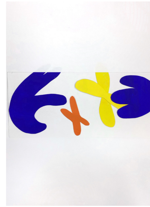
Bannière web pour un site d'assurance maladie

Cette affiche a été pensée pour être placardée dans les stations de métro. Le fond est noir puisque les spectacles jouent sur la lumière et se passent donc avec des fonds noirs et une luminosité réduite. Au centre, un acrobate de la troupe réalise une figure sur les mains. Derrière lui, un halo jaune symbolise la lumière mais aussi le soleil pour faire allusion au nom du cirque. Les formes colorées tout autour font allusion aux costumes toujours colorés de la troupe, mais aussi au mouvement. En haut à droite, un autre acrobate réalise une numéro sur un trapèze, la tête en bas.