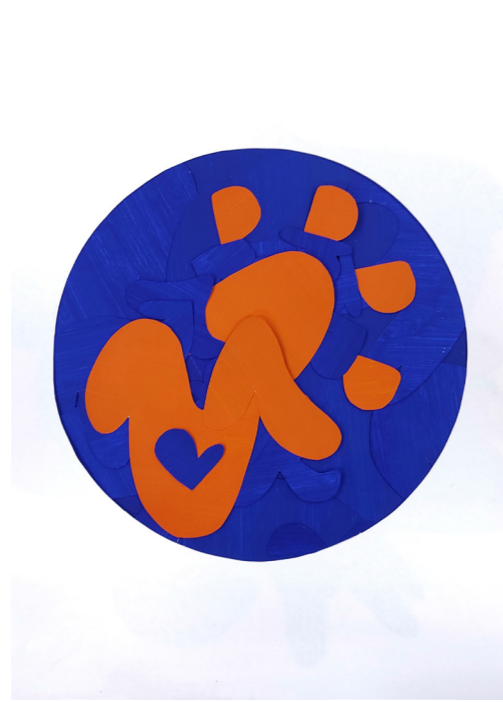
Logo rond pour un vétérinaire

J'ai choisi de prendre un fond noir ainsi que de travailler avec une seule couleur pour évoquer le prestige et le côté luxueux de cet établissement. L'affiche ne présente qu'un ananas, met très rare et prisé à l'époque de la Renaissance et symbolisant donc ici la rareté et l'exception des plats proposés par ce restaurant.