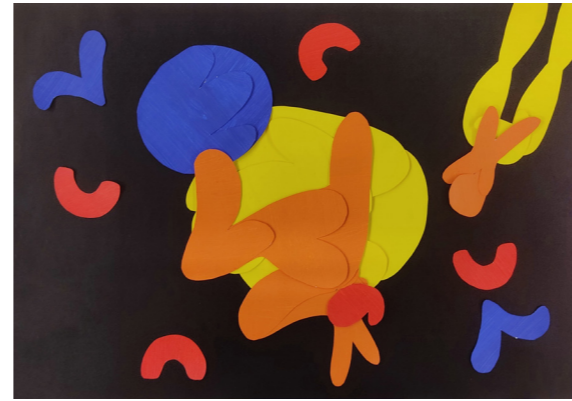
Affiche pour un spectacle du Cirque du soleil

Le motif représente des bonhommes qui sont joyeux et tristes afin de s'accorder avec l'humeur de la journée. Les couleurs colorées ainsi que la tête des bonhommes donnent le sourire et encouragent à passer une bonne journée en portant cette salopette.