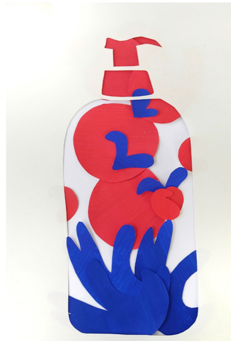
Habillage d'une bouteille de shampoing à la fraise

Choix du bleu qui symbolise la santé selon moi et le orange pour le côté animal, rappelant le pelage des animaux. La tête de chien prend la forme d'un V pour «vétérinaire» et la patte en arrière plan renforce l'empreinte «animale», symbolisant cette profession.