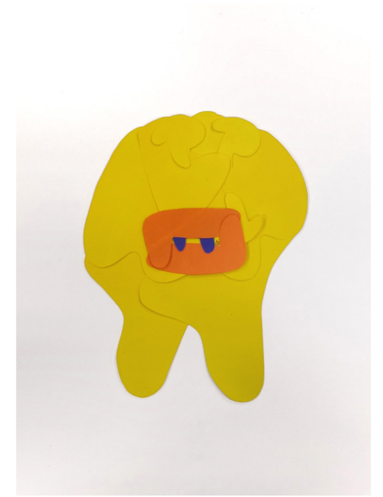
Affiche pour le congrès annuel des dentistes de France

Ce post a été pensé pour en réaliser une variante, sous forme de «reel» Instagram où le tourbillon jaune du milieu tournerait. Ce post a été imaginé pour une marque de baskets dites «écologiques», faites à partir de plastique recyclé. Le tourbillon jaune et rouge symbolise donc le cycle de vie de la matière, qui se perpétue. Les deux mains, des deux côtés du tourbillon, renvoient aussi à l'aspect éthique de cette marque puisque les baskets sont fabriquées dans le respect des ouvriers. Les couleurs sont contrastées pour symboliser la dynamique de la marque et l'aspect sportif.