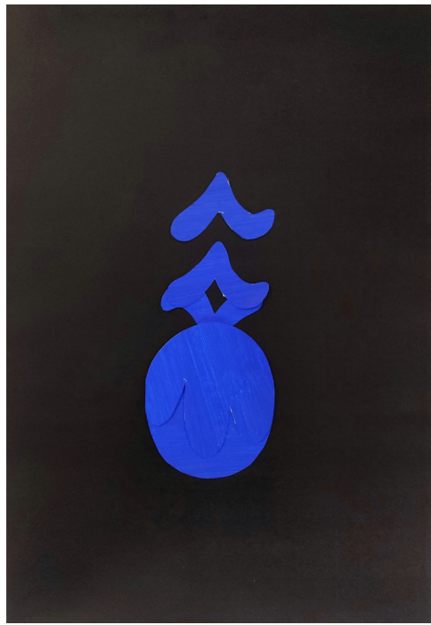
Affiche pour un restaurant étoilé

J'ai choisi de prendre un fond noir ainsi que de travailler avec une seule couleur pour évoquer le prestige et le côté luxueux de cet établissement. L'affiche ne présente qu'un ananas, met très rare et prisé à l'époque de la Renaissance et symbolisant donc ici la rareté et l'exception des plats proposés par ce restaurant.