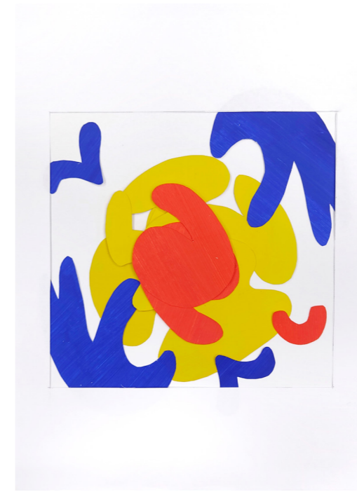
Post instagram pour une marque de chaussure de sport

Choix du bleu pour symboliser l'eau et le savon et du rouge pour la fraise. Les fraises, symbolisées par des ronds rouges surmontées de petites «queues», rappellent également des bulles de savon qui s'échappent. En bas, les formes bleues symbolisent des algues ou des vagues.